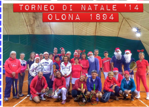
TORNEO DI NATALE '14 OLONA 1894