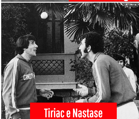
Tiriac e Nastase