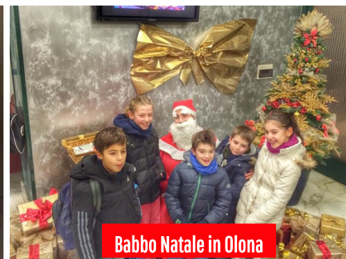
Babbo Natale in Olona