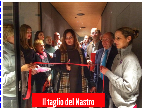
Il taglio del Nastro